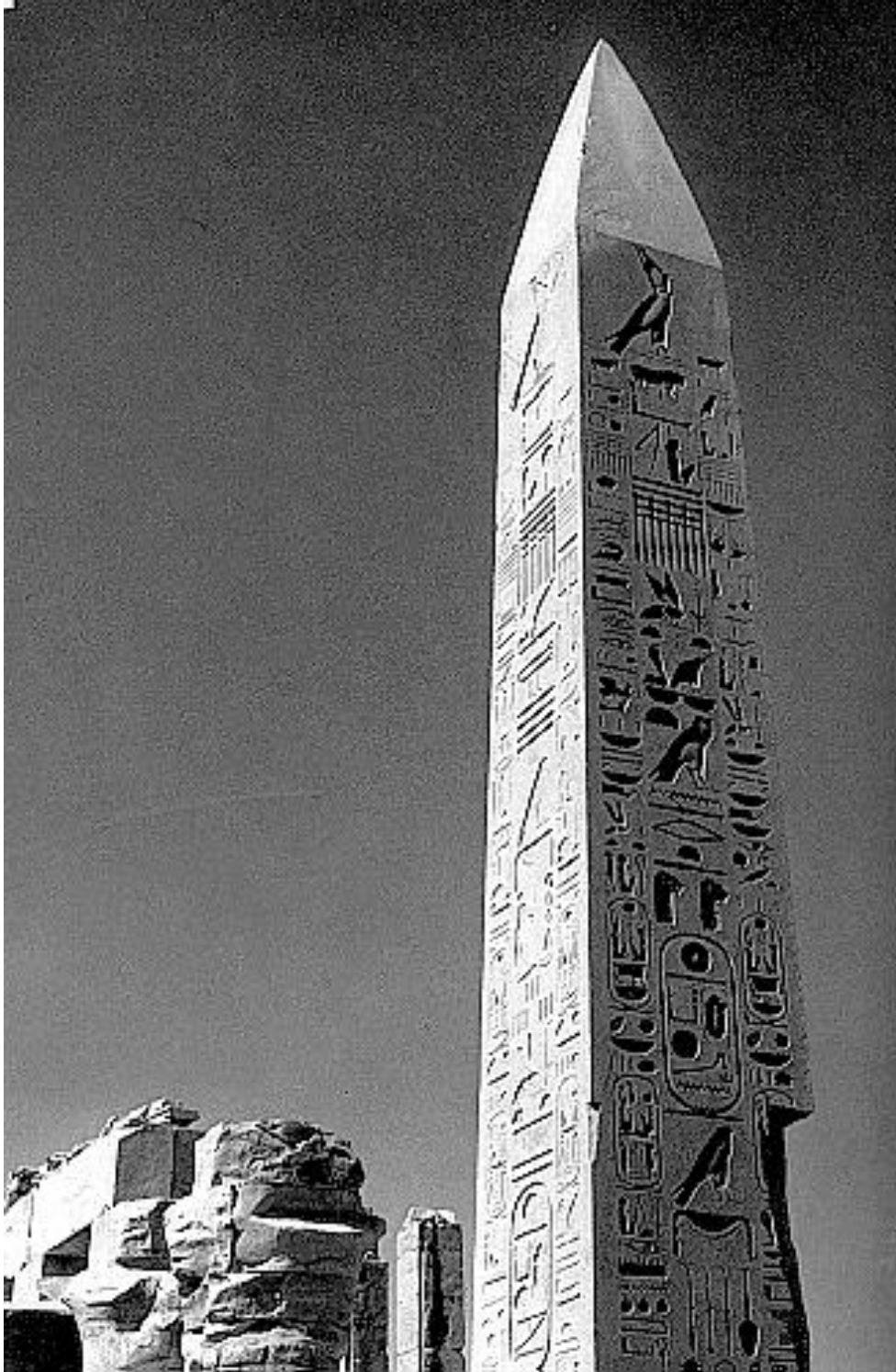
Karnak. Hatshepsuts obelisk