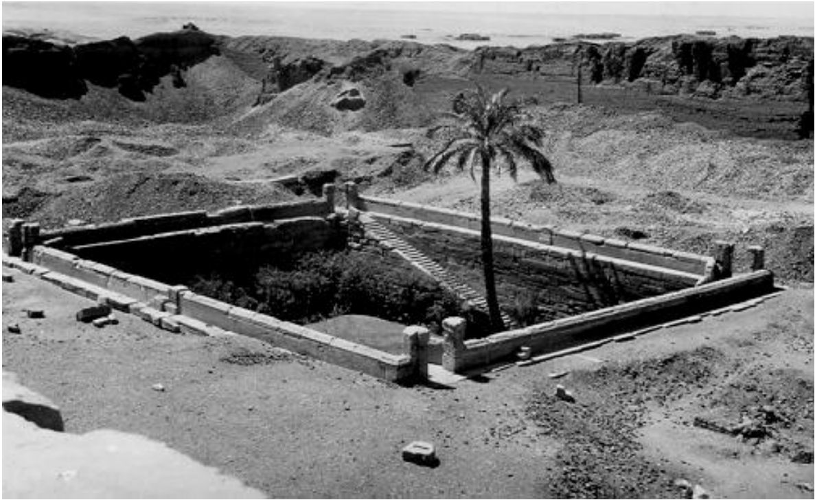
Bassängen vid Dendera. 15 meter djup