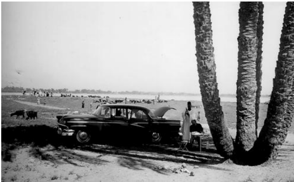
Lunchrast vid Dendera

Trappor leda upp ytterligare till taket på Osiristemplet, varifrån man har en vacker utsikt över trakten vida omkring. Ovanpå Hathor-templets nordvästra hörn finns uppe på taket en s.k. Hathor-kiosk. Den är utan tak. Norr om templet finns en helig bassäng, som uppgavs vara Kleopatras badbassäng. Det är den vanliga ceremonibassängen som finns vid de flesta tempel. Efter tempelbesöket och studierna intog vi lunchen under några palmer öster om templet. Där finns visserligen en raststuga, men den var nybyggd och ännu ej öppnad. Vi satte därför upp vårt pick-nick bord i det fria med fårhjordar, åsnor, kameler och ungar runt omkring oss. Kamelerna är tjuvrade på ett enkelt sätt genom att frambenen bundits ihop med ca 3 dm lång bindning. Den gör att kamelerna blott långsamt kan röra sig, i synnerhet som de är passgångare, d.v.s. de för fram ena sidan fötter samtidigt på en gång och så den andra sidans nästa gång. Med den utförda hopbindningen av frambenen blir det lite svårt för dem att balansera och de får bekväma sig med att röra sig ytterst sakta och försiktigt. Lunchen smakade oss ypperligt, men den var alltför riklig och det som blev över, och det var inte lite, fick herdarna runt omkring oss dela. Och de såg glada ut åt det nya tillskottet i sin dagliga meny.