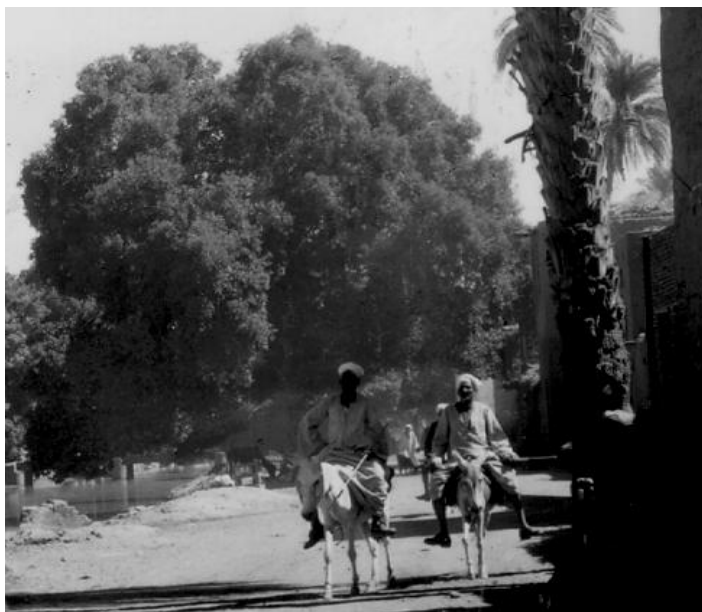
Vägen vid Esna

Vi undrade just vilka efterblivna europeiska ingenjörer som gjort denna så primitiva skötselordning utan motorbetjäning vid den annars ganska imponerande ingenjörsskapelse som dammen är. Inte lär det vara tyskar. Vi gissade på engelsmän. Är det riktigt gissat männe? Under färden från Gurna till Esna fick vi ytterligare en inblick i vardagslivet härnere. Längs landsvägen går en järnväg och det var intressant att se att även järnvägen var en folkets vandringssväg. Hela karavaner av folk och tungt lastade åsnor såg vi i en flera kilometer lång rad på vandring i spåret och det tåg, som kom efter tutade i ett. Ja det är i Egypten sådant går för sig.