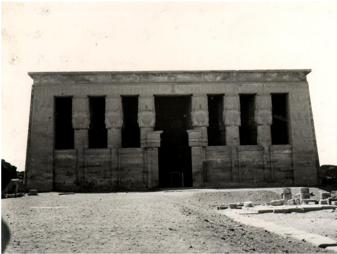
Dendera. Hathortemplets ingångspylon.