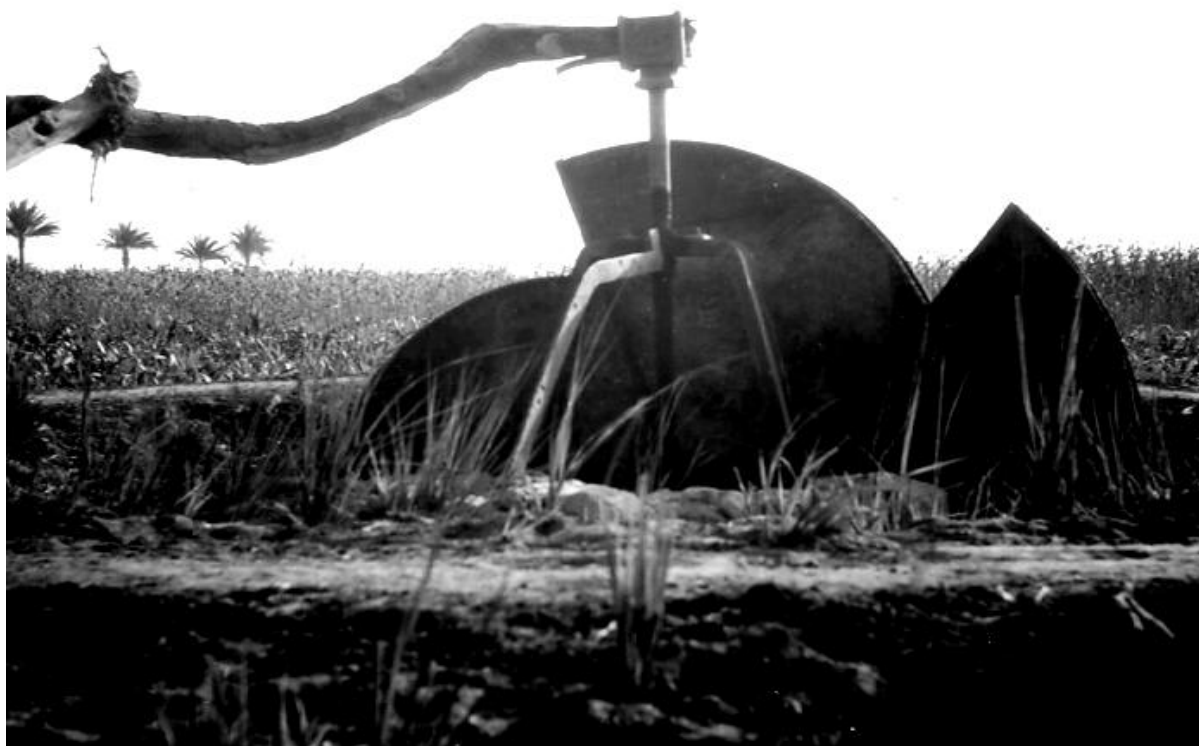
Bevattningsanläggning av typ Saqia.

Vattenbufflarna ligga nedsänkta med huvudet och näsan i vattenytan och njuta av vattnets någorlunda skyddande svalka, och barn simmar och plaskar i kanalernas gulbruna slamvatten. Nilens vatten luktar på ett särskilt sätt, det är inte en god lukt. Nilen sjunker alltjämt och i de frilagda områdena av gytta passar man på att suga upp i gropar och plantera majsplantorna innan jordskorpan blir för hård. Här gäller att skynda på ty den brännande solen gör lerskorpan snart stenhård. Nilen är på annat sätt en livsnerv. På den går den tunga trafiken, under det att blott lättare trafik går på de usla vägarna, som därför tydligen inte behöver vara bättre än de är - fast en stackars europeisk bilist ställer andra krav på dem. Nilen påstås komma att sjunka ytterligare 7 meter, och då kommer öar fram, som inte synas nu.