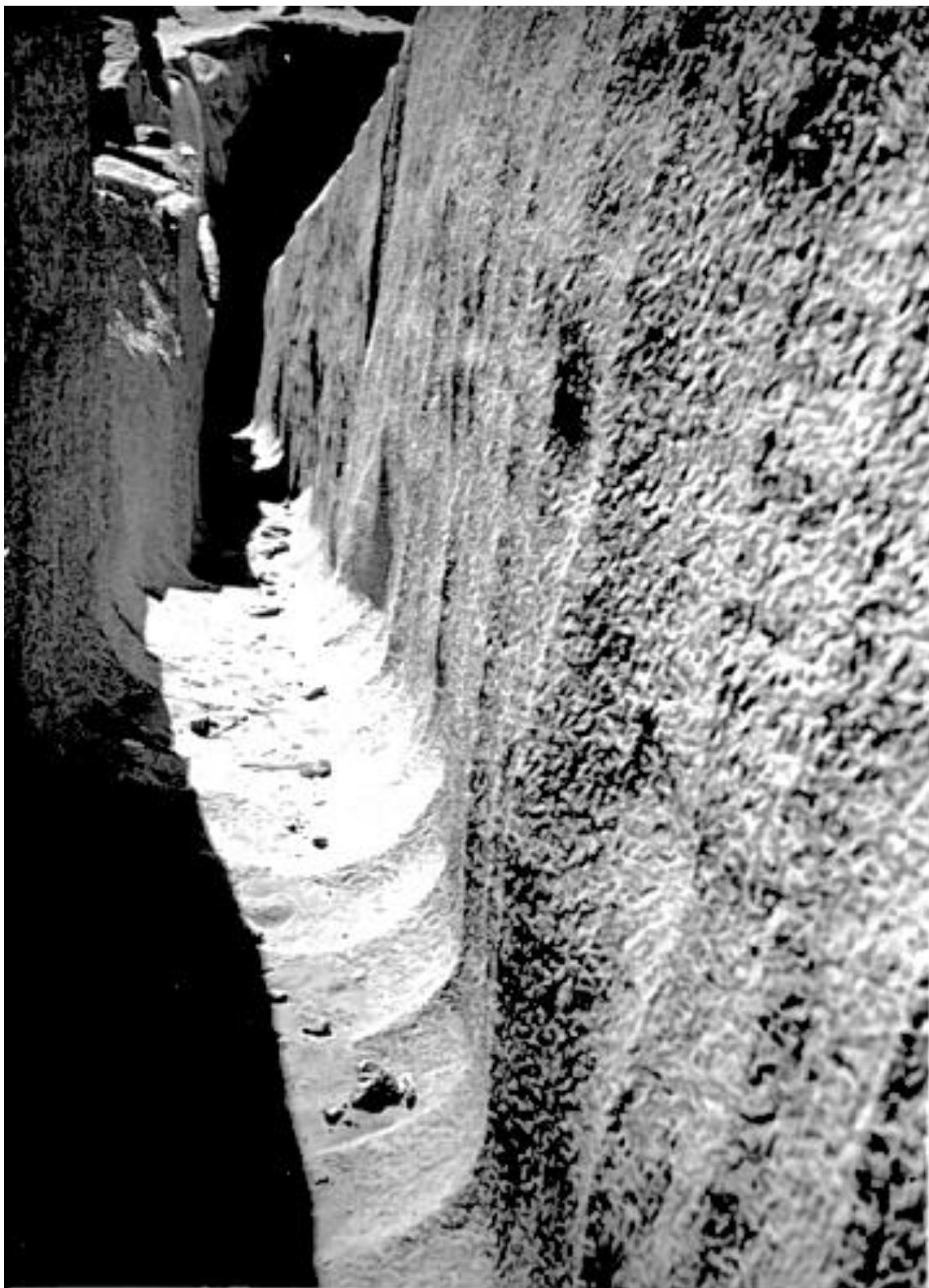
Sidoschakten med de tydliga fräs-spåren.

och ända ned till botten där avrundningen mot obeliskan och mot den motstående bergssidan visade rundningen och storleken av frästrissorna, som varit 70 cm från varandra med sina ytterkanter. Matningsdjupet visade sig vara 30 cm. Det syntes mig som om med en maskin som kommit till användning det varit en mycket enkel sak att snabbt fräsa fram den stora stenkolossen. Vilket land kan nu uppvisa sådana jättestenverktyg? Dessutom fanns det fyra stycken fyrkantiga hål 70 cm i fyrkant som ”borrats” direkt ned med ett verktyg för borring