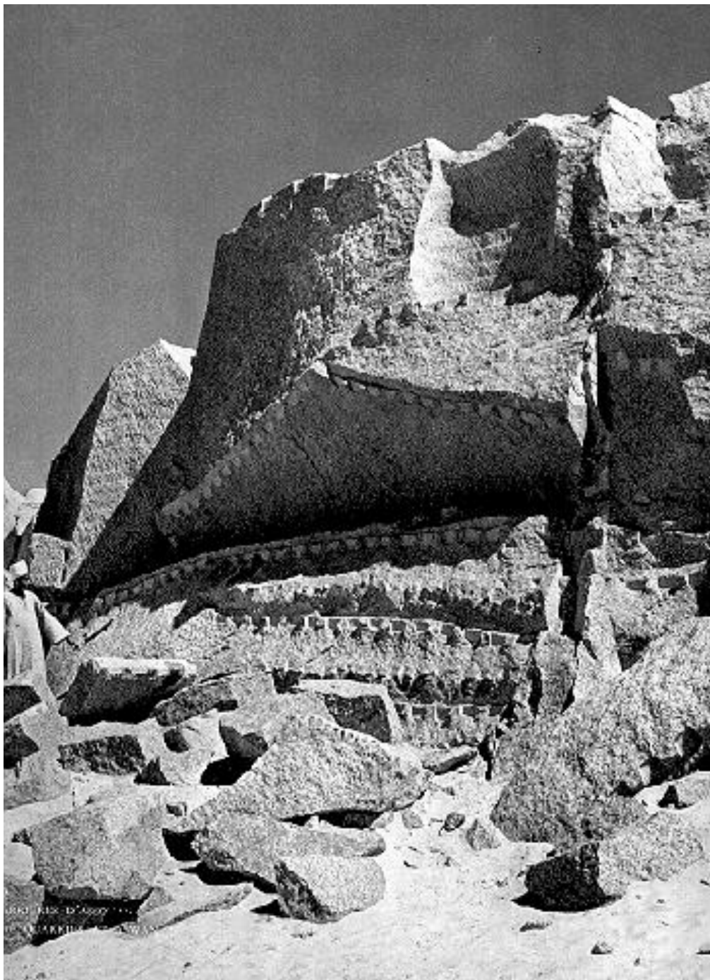
Stenbrottet i Assuan. Kreneleringen av kilspår efter brytningen.

under skuggan av några palmer och inmundigade vår medhavda lunch. Det som blev över fick en på en åsna passerande arab. Flera gånger körde vi fel. En gång följde vi vid en korsväg den bredaste och hamnade efter tre km mitt inne i en arabby där vägen helt enkelt tog slut. Vi hade förstås svårt att göra oss förstådda. Jag hade ju tagit en kurs i arabiska, en Linguaphonekurs för att bättra på den arabiska jag lärt under två terminer vid Stockholms Högskola för ett tiotal år sedan, men den Linguaphonekursen var ganska värdelös. Det som en bilist behöver kunna, fråga om vilken by det var, vad nästa hette, om vägen till Kairo etc. innehöll kursen inte ett ord om. Vi fick vända förstås och följa den bibliska regeln, att följa den smala vägen. Här hade vi tillfälle att se att det stämde i praktiken.