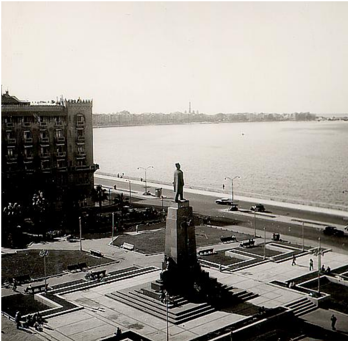
Alexandria. Utsikten från vårt hotellfönster.

I Alexandria hittade vi utan svårighet till vårt hotell - Metropol, sedan vi vid infarten till Alexandria färdats på en vägbank med vatten på ömse sidor och stora ruggar av meterhög, kraftig vass. I Alexandria var vi sedan ute och orienterade oss om fartygets kajplats, så att vi lätt skulle hitta dit nästa morgon för att i god tid få våra papper behandlade. Efter förfriskningar i baren gjorde vi en shoppingrunda i stan. Hotellet är bra med utsikt över Medelhavet. Från rummen hade vi en tjugsig utsikt, och på kvällen avfyrades det ett timslångt fyrverkeri. Det var inte till vår ära. Det var någon militärhyllning, ty i Kairo var det ju på morgonen stora militärparader till ett dovt trummande. Trafiken inne i Kairo var också lite desorienterad och hindrade något litet vår avfärd.