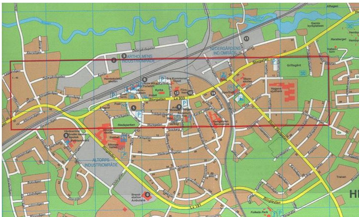
Thebe-bassängens mått inlagda på Herrljunga-karta