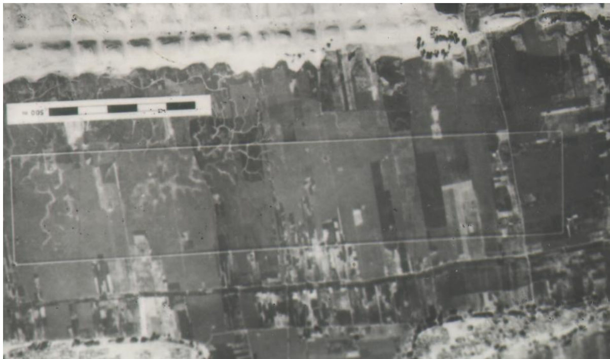
Flygbild över bassängresterna vid Amenofis III:s palats "Malkata" i Thebe Bassängen var 1940 x 370 meter Längs bassängens östra kant (upptill) var en rad små prydnadspyramider byggda.