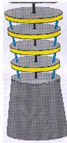
Skiss av Djed-pelare